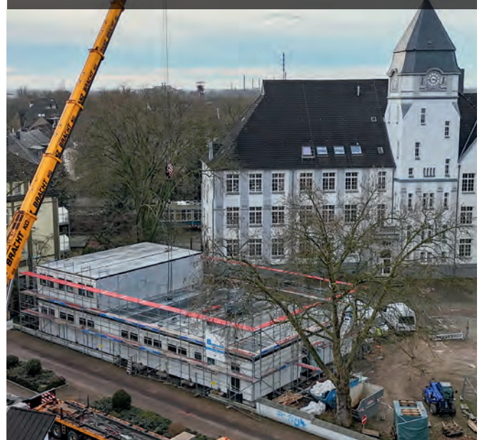
Modulbau an der Turmschule

sollen bis zum Beginn des Schuljahres 2024/2025 fertiggestellt werden.