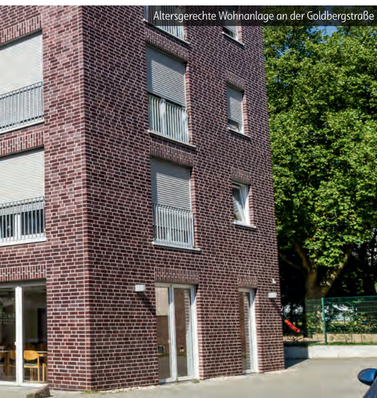
Altersgerechte Wohnanlage an der Goldbergstraße

Ein ähnliches Neubauprojekt ist in Erle entstanden. An die Stelle eines alten, abbruchreifen Hotels ist nun mit dem Heidehof ein attraktiver Neubau mit 31 modernen, barrierearmen Wohnungen entstanden. Anfang 2024 zogen die ersten Mieter ein. Der Heidehof, errichtet nach dem KfW-Effizienzhaus-Standard 55, leistet außerdem mit Pelletheizung und Photovoltaikanlage einen wichtigen Beitrag zur Reduktion von CO 2 -Emissionen, schont Ressourcen und steht damit beispielhaft für nachhaltiges Bauen.