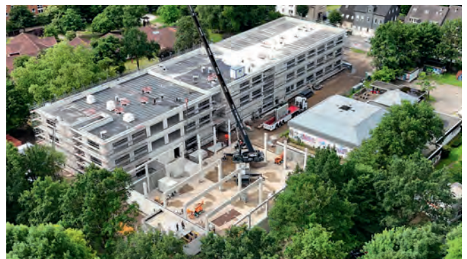
Grundschule An der Gräfte

Es ist nach Fertigstellung der Grundschule Ebersteinstraße das zweite Gemeinschaftsprojekt der Stadt Gelsenkirchen und ggw: der Um- und Neubau der vierzügigen Grundschule in der Kurt-Schumacher-Straße mit integrierter zweigruppiger Kita und angeschlossenem Familienzentrum. Im Oktober 2023 wurde Richtfest gefeiert, inzwischen sind alle Fenster eingebaut, die Dachdeckerarbeiten abgeschlossen, so dass nun die Gerüste abgebaut werden konnten. Aktuell hat die Neugestaltung der Außenanlagen begonnen. Die Eröffnung von Schule und Kita planen wir für den Beginn des Schuljahres 2024/2025.